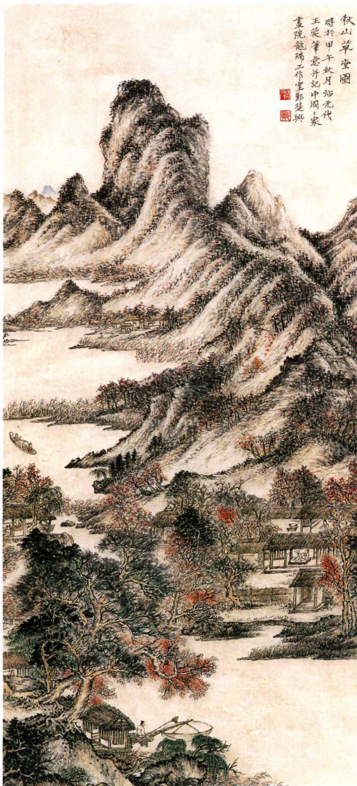
郑楚兴 秋山草堂图 纸本设色 111×50厘米 2014

中国画创新饱含着对过去的扬弃和继承。时下许多中国画家走的是一条西方式的习画之路，特别是上世纪80年代以来西方观念艺术的介入使得中国画在造型手法上生发出许多新问题。比如，大多数画家是先画轮廓，然后再添加纹理，这就使得笔墨成了明暗光影质感的一部分。在此情况下，中国画笔墨意义和笔墨语汇起不到应有的作用。实际上，这种造型手法导致许多中国画画家形成了一种不中不西、似是而非的风格，并导致中国画的造型手法受到遮蔽。为此，我们必须加以关注和探讨。下面，笔者就从平面造型、意象构成、意象组合三方面出发，对该问题加以探讨。