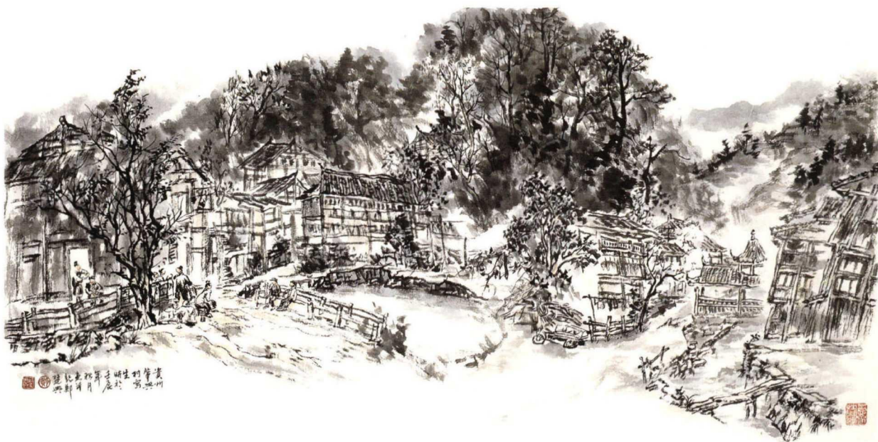
郑楚兴 贵州肇兴村写生 纸本水墨 68×136厘米 2012