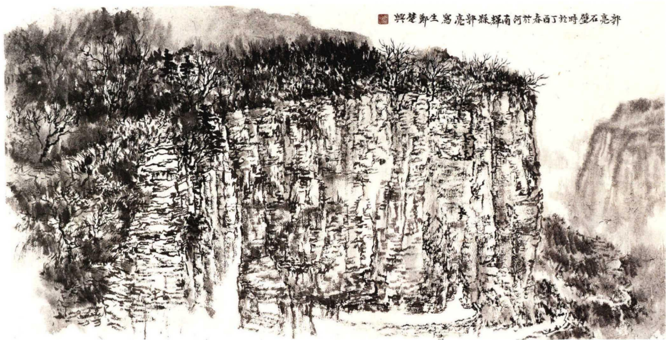
郑楚兴 郭亮石壁 纸本水墨 69.5×139厘米 2017

郑楚兴 1961年生，广东潮阳人。1988年毕业于广州美术学院美术教育系，1998结业于广州美术学院国画系研究生主要课程高研班，2015年结业于中国国家画院龙瑞工作室高研班。现为广东汕头职业技术学院美术副教授，中国山水画协会会员，广东美术家协会会员。